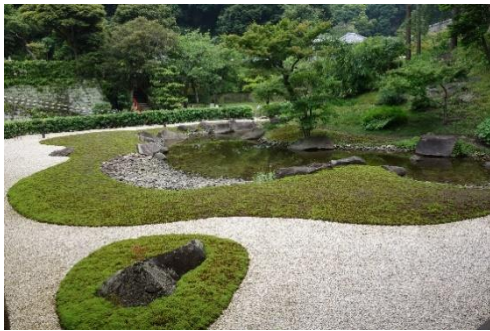
大書院から眺めた方丈裏庭園