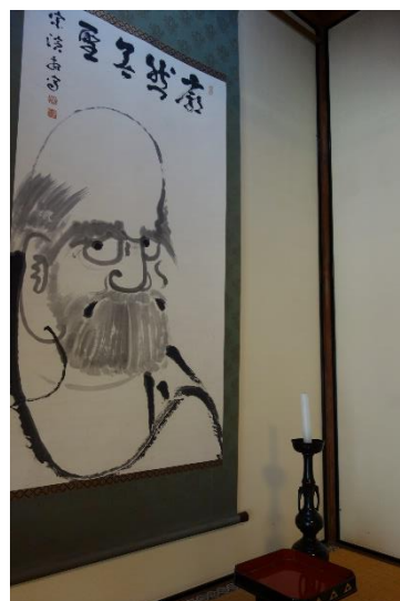
大書院の掛け軸(例)