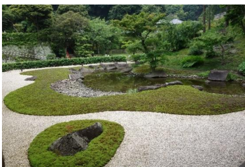
大書院から眺めた方丈裏庭園