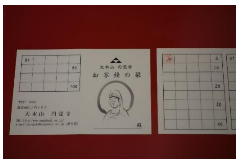
(「お写経の葉」スタンプカード)