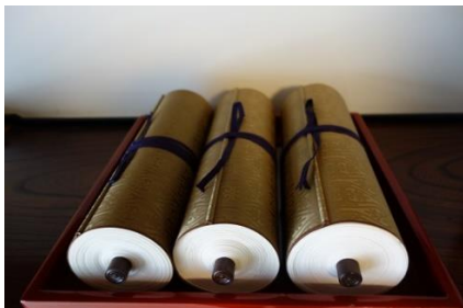
巻物にされたご納経