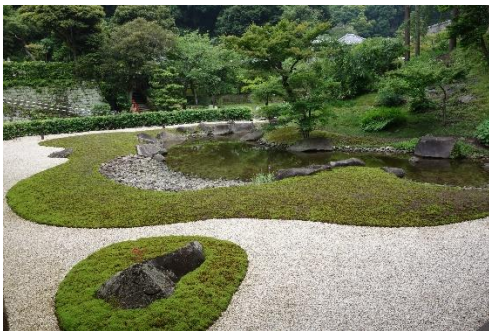
(左)大書院から眺めた方丈裏庭園