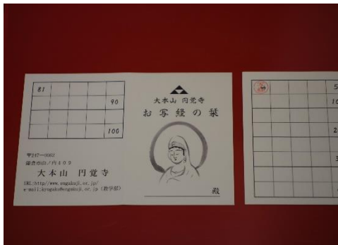
(「お写経の葉」スタンプカード)