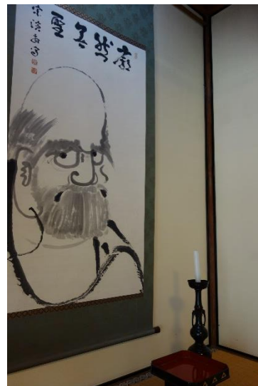
大書院の掛け軸 (例)